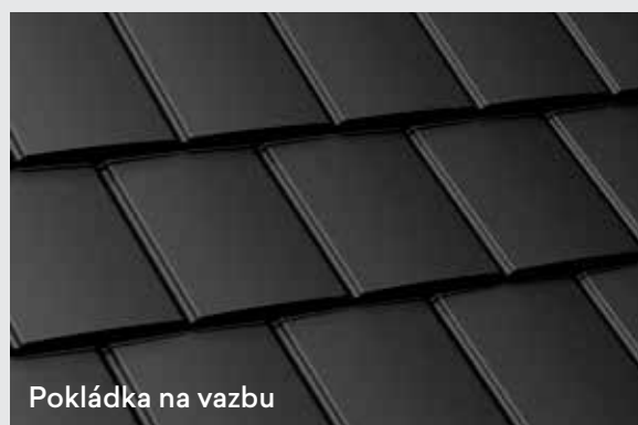
Pokládka na vazbu

Tašky Isola Powertekk Plano lze pokládat dvěma různými způsoby. Na střih a na vazbu.