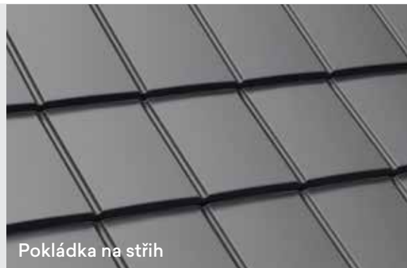
Pokládka na střih

Boční přesah tašky 60 mm zaručuje vyšší bezpečnost proti zatékání vody při silném dešti a větru.